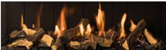
Leños cerámicos (de serie) / Ceramic logs (standard)